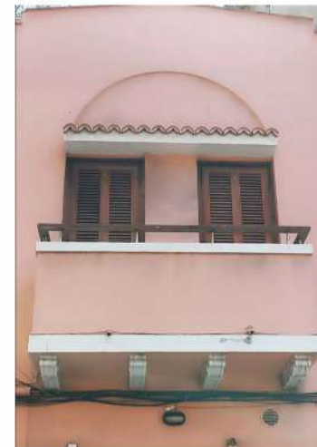
BALCÓN Y ARCO DECORATIVO