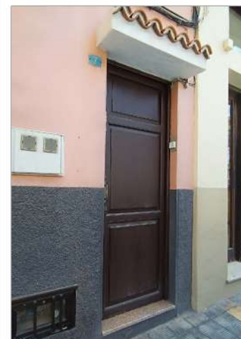
FISIONOMÍA DE PUERTA