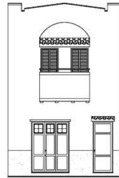
FACHADA FE 1:150 C/ Pérez Zamora, 7