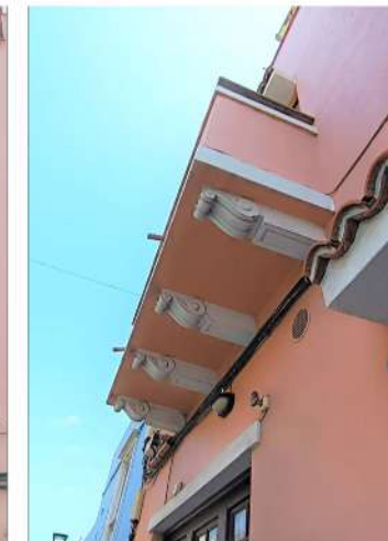
CANES DE HORMIGÓN