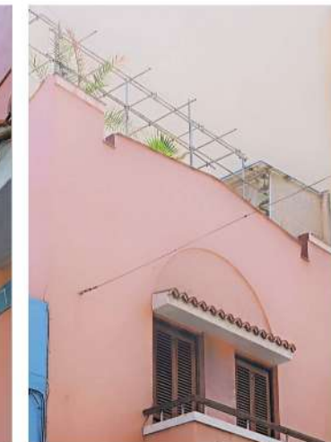
MURO DE CORONACIÓN