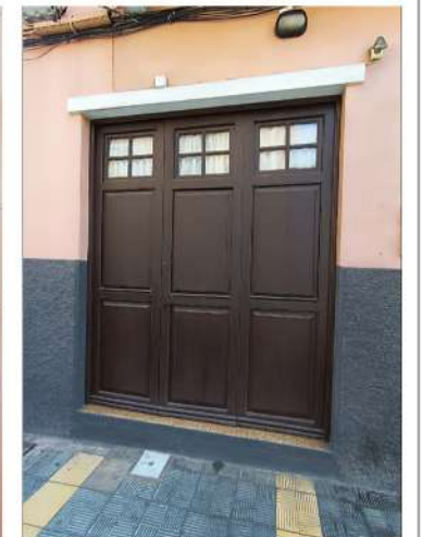
FISIONOMÍA DE PUERTA