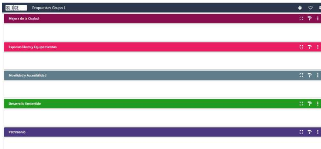
Ilustración. Ejemplo de metodología para los talleres virtuales de propuestas

Una vez concluida la lluvia de ideas, en esta misma pantalla se realizarán votaciones con el fin de definir qué propuestas resultan de mayor interés para los asistentes al taller.