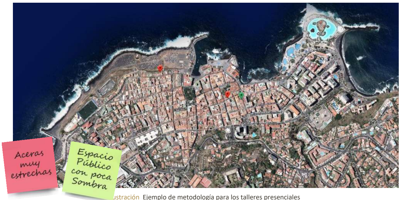
Ilustración Ejemplo de metodología para los talleres presenciales