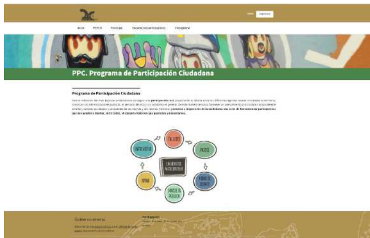
Ilustración captura de la pestaña dedicada al PPC en la página web del PEPCH

publique información sobre el resto de los espacios a participar así como de las devoluciones resultantes de éstos, además del establecimiento de un formulario de preguntas de diagnóstico y propositivas, que estará abierto durante todo el proceso participativo.