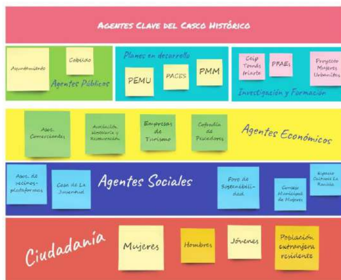
Ilustración Mapeo de agentes clave vinculados al Conjunto Histórico de Puerto de La Cruz

Surgirá, una vez definidos los intereses del Plan, a partir del intercambio de información y datos entre el equipo redactor y la administración involucrada, con el fin de detectar posibles agentes clave a tener en cuenta en el desarrollo del proceso participativo. Nos acercamos de este modo a los sectores a los que vamos a escuchar, personas interesadas en la generación y ejecución de un nuevo plan, existencia de movimientos formales e informales a favor o en contra del plan, etc.