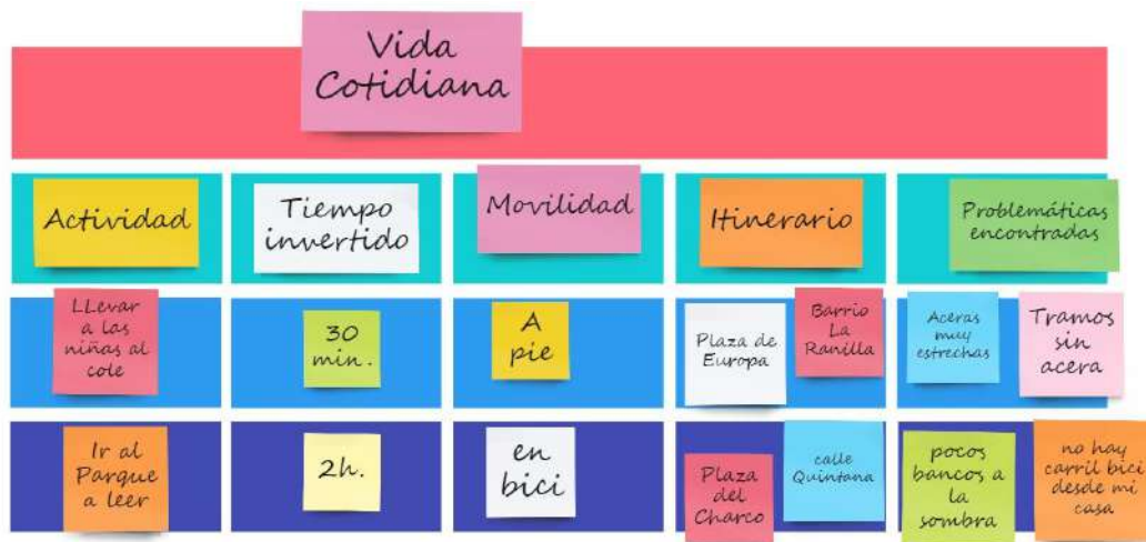
Ilustración Ejemplo de metodología para los talleres presenciales